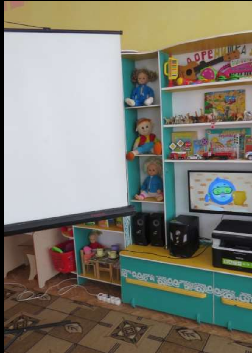
1.7. Рабочий сектор (ИКТ для педагога)