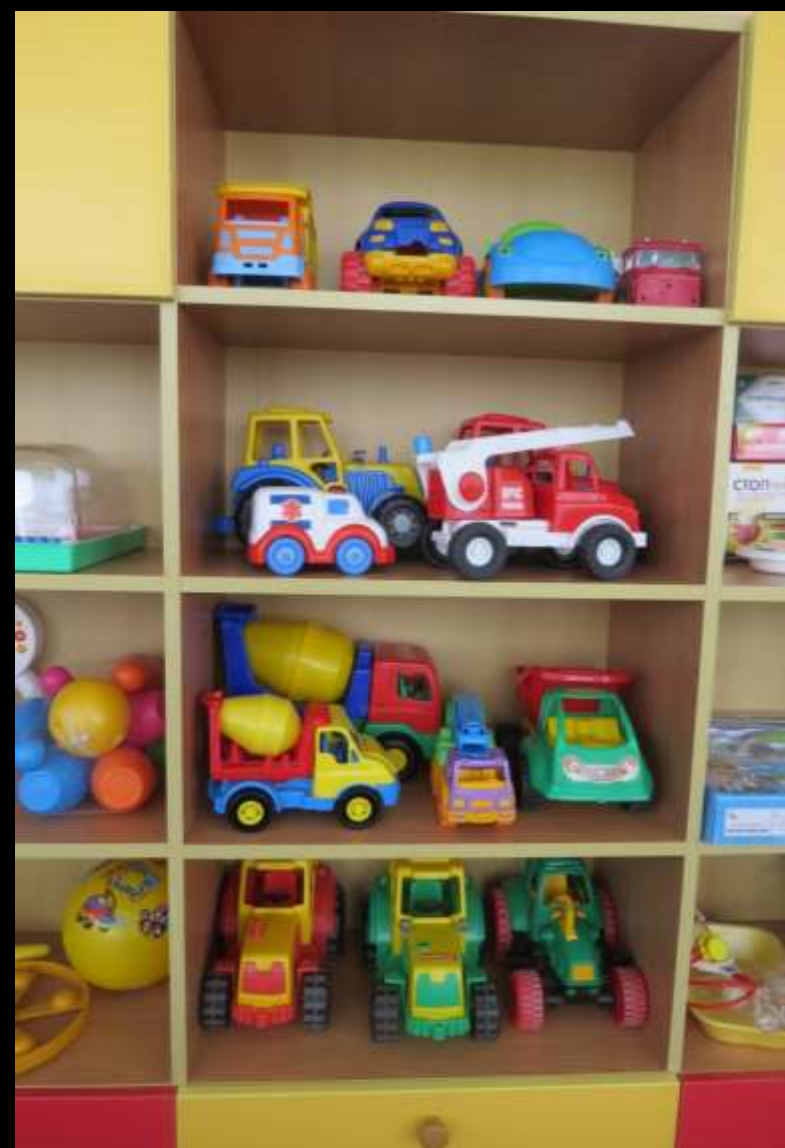
2.2.5. Активный сектор

Наличие атрибутов театрализованной деятельности (ширма-занавес, куклы-перчатки, театральные костюмы и др.), в том числе изготовленных вместе с воспитанниками.